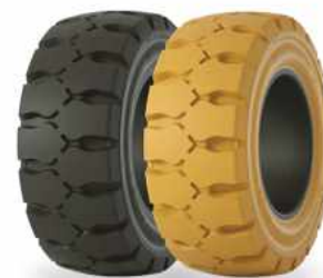
ELTOR 3 ELTOR 3 no marking

• Протестированная структура, которая всегда обеспечивает хороший пробег. • Высокая стабильность, подходит для больших вилочных погрузчиков. • Отличный комфорт в любой ситуации.