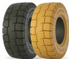
ELTOR EVO ELTOR EVO no marking

Компания «Погрузчик.рф» является эксклюзивным и единственным продавцом шин Marangoni для вилочных погрузчиков в России. Цельнолитые шины для складской техники любых размеров всегда в наличии на складе в Москве.