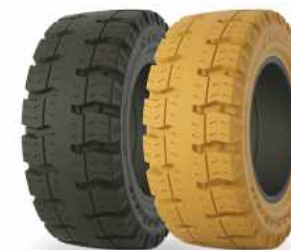
ELTOR FORZA ELTOR FORZA no marking

• Качественная альтернатива нормальным требованиям и стандартным приложениям. • Хорошая тяга. • Низкое сопротивление качению. • Высокая надёжность.